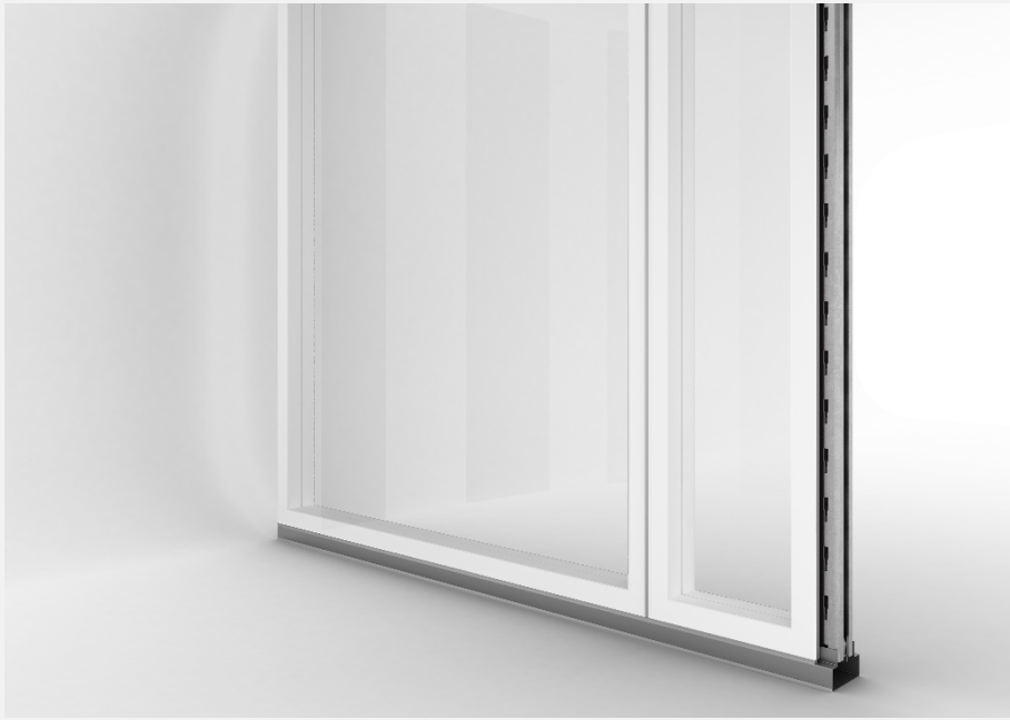
Verglasung Multiclean CPH 448