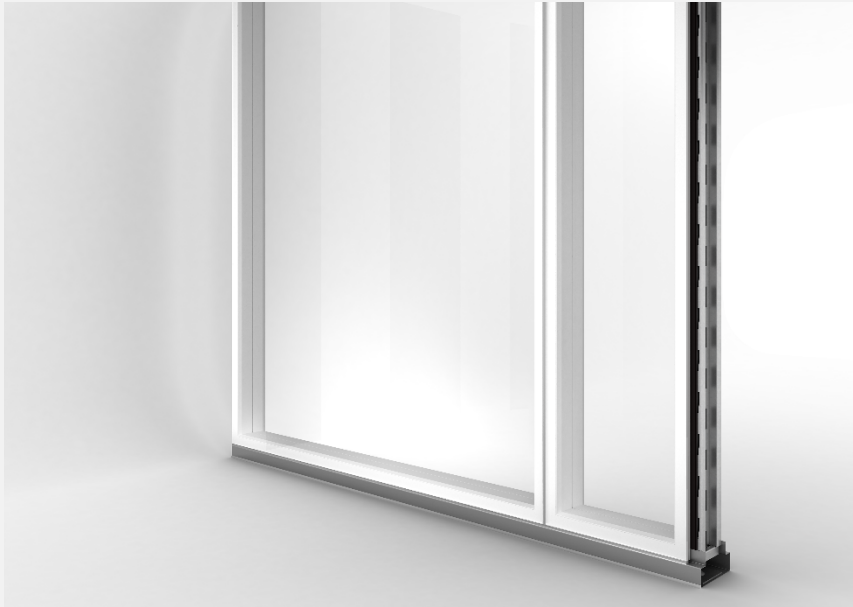
Verglasung Multiclean LVT 437