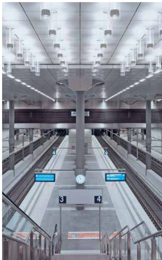
Gare centrale, Berlin

Pour la gare centrale de Berlin, nous avons réalisé différents systèmes de plafonds de grande envergure comme des plafonds en grillage, en aluminium et en métal spécial, ainsi que des plafonds en métal déployé dans les zones extérieures et intérieures. En outre, Lindner s'est chargée du second œuvre complet, incluant les revêtements en aluminium et en acier spécial (rampes d'escaliers, local technique) ainsi que la gestion des corps techniques et deux centres de voyage. Architectes : von Gerkan, Marg und Partner