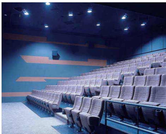
Cinema Flora, Prague

Avec Lindner, faites de votre projet un véritable chef d'œuvre ! Nous réalisons l'isolation acoustique (avec ou sans exigence de protection incendie) entre les différentes salles de cinéma. Nous fournissons à cet effet et selon les besoins des revêtements de plafond efficaces en terme d'acoustique dans différents matériaux tels que le tissu ou le métal – selon vos souhaits et vos exigences. Notre programme de livraison comprend également la construction d'estrades complètes (charpente en acier), la pose de revêtements de sol et de sièges. Ainsi, nous pouvons vous garantir un éventail de prestations complet adapté à vos besoins.