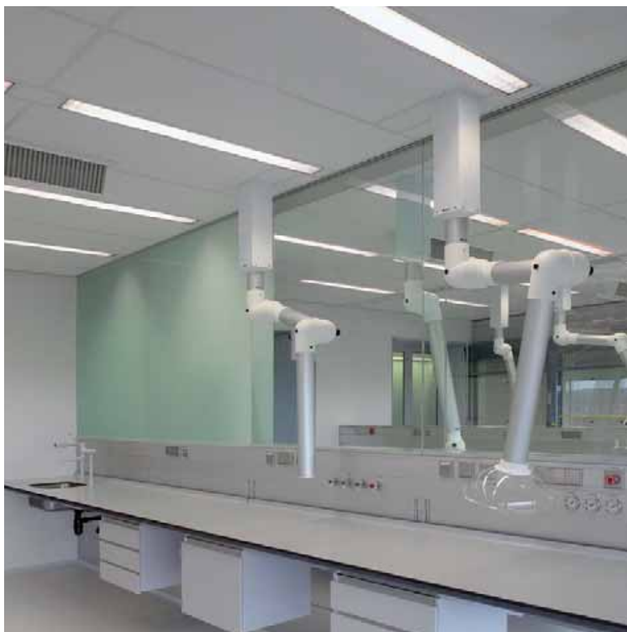
NFI, La Haye (NL) – Les parois sur-mesure du laboratoire, les alimentations électriques des robots et le mobilier du laboratoire ont été réalisés pour ce projet par Lindner