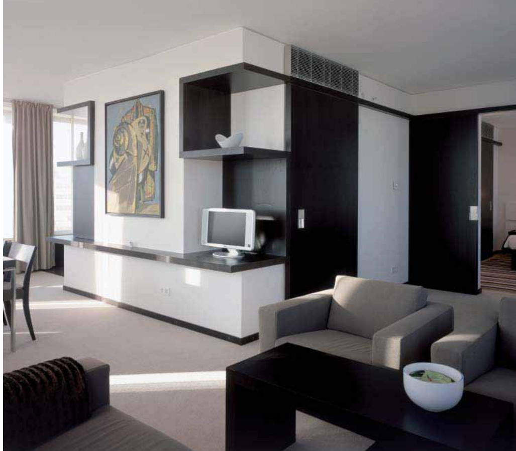
Hôtel Concorde, Berlin

Pour ce projet, Lindner Objekt-design a exécuté l'ensemble de l'aménagement intérieur : tous les travaux de pose à sec, de pierre naturelle et de métaux, tous les travaux de menuiserie, l'agencement des 311 pièces et suites avec rideaux et éclairages, l'agencement de la zone publique en totalité et la pose des revêtements de sol en bois et textile.