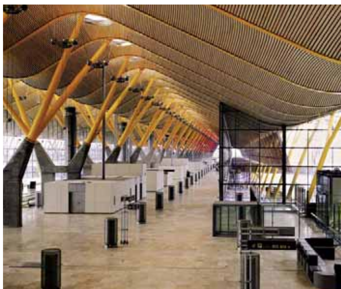
Aéroport international de Barajas (NewT4Terminal), Madrid Architectes : Richard Rogers Partnership, Estudio Lamela

Les aéroports et les gares requièrent souvent des constructions spécifiques. Nous élaborons suite à des demandes particulières nombres de prestations : des plafonds individuels, des éclairages, des systèmes de chauffage et de refroidissement, des sols, des cloisons, des revêtements, des portes, des façades, des isolations, des constructions en métal... En tant que spécialistes des façades et de l'aménagement intérieur, nous allions un design exceptionnel à une fonctionnalité maximale - n'hésitez pas à vous fixer des objectifs de taille pour vos projets de construction.