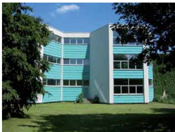
Centre de formation, Seelze und Letter

Assainissement complet parallèlement à l'exploitation de l'édifice : la prestation inclue la planification de l'exécution, l'assainissement de la salle de sport, l'élimination des déchets toxiques et le financement en tant que projet PPP.