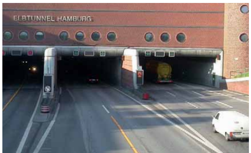
Tunnel de l'Elbe Conduits 1, 2 et 3, Hambourg

Amiante, PCB, PCP, DDT, PAK, aldéhyde formique, laine minérale et moisissures.