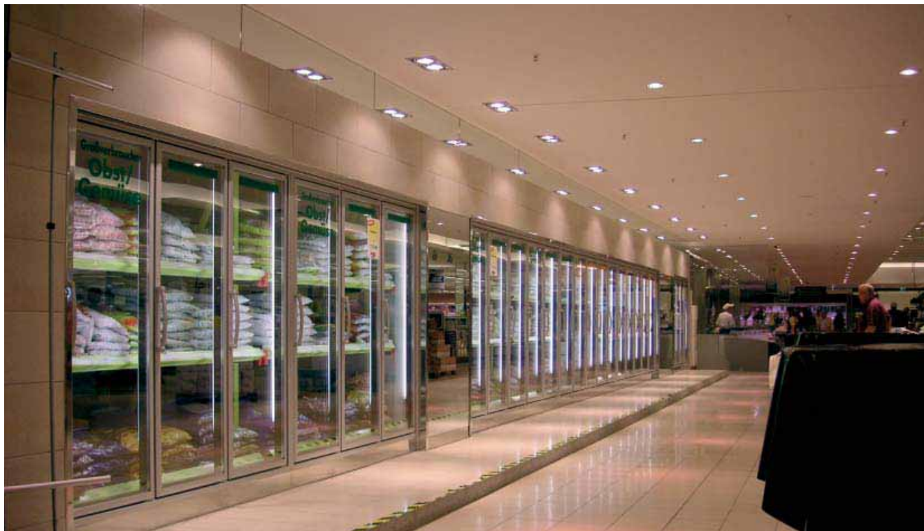
Linéaires de surgelés dans un hypermarché - Lindner a réalisé les pièces d'entreposage et frigorifiques de la zone de vente.