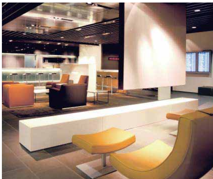
Salon première classe Lufthansa, Francfort am Main Architectes : Bernd Hollin, Alexander Radoske

Peu importe que vous fassiez le tour du monde ou que vous rendiez visite à un ami dans une autre ville : grâce aux salons élaborés par Lindner, le séjour dans les aéroports et les gares est sûr, agréable et fonctionnel pour tous les passagers. Nous prenons en charge dans cet esprit la planification totale de vos projets ainsi que l'agencement de la pièce. Avec Lindner, vos projets arrivent à bon port!