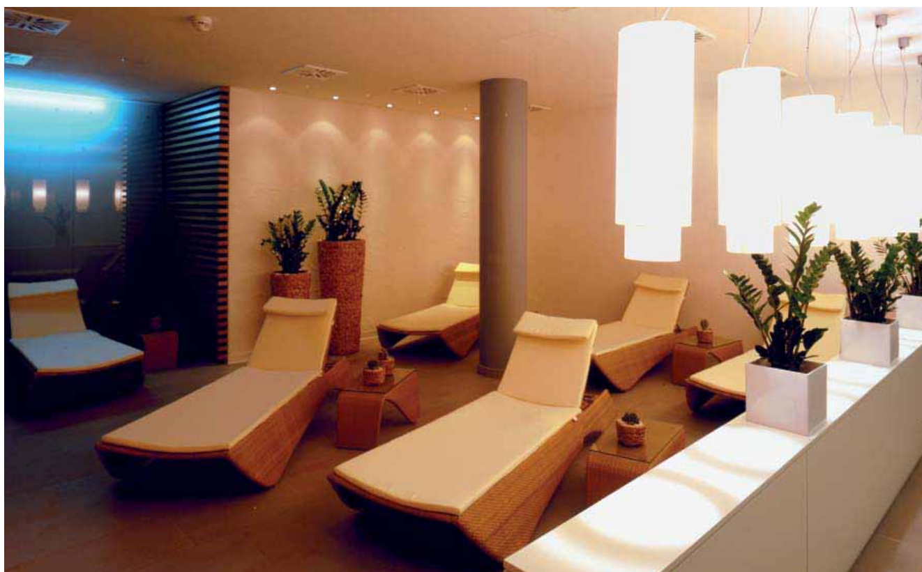
Illustrations: Hôtel Inside, Francfort sur le Main

Pour l'hôtel Inside de Francfort, Lindner a exécuté avec succès les prestations suivantes : travaux de démolition, de charpente et de maçonnerie, de construction métallique, de béton et de béton armé, de plâtre et de stucage, pose à sec entière et réalisation des façades. En outre, Lindner a fourni et monté les portes en bois et les cloisons.