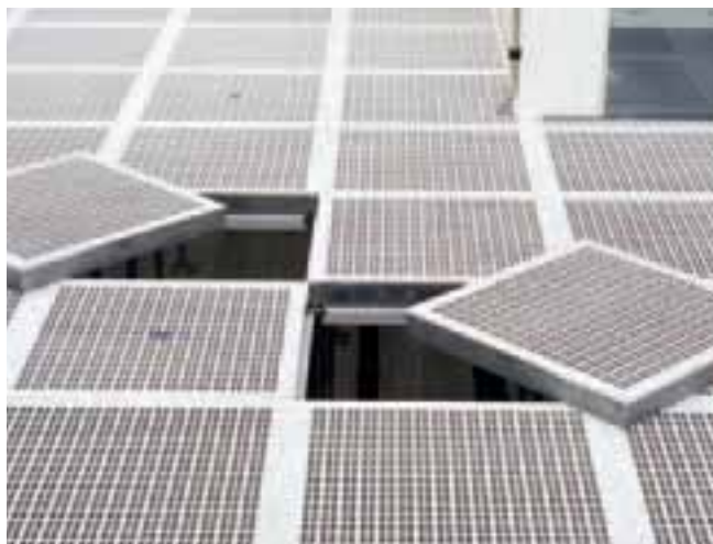
Technische Universität, Dresden