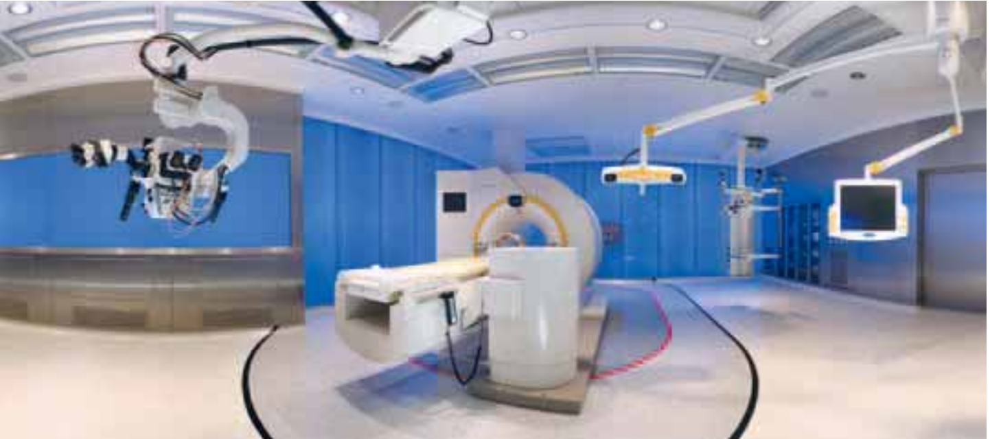
BrainSUITE, King Fahad Medical Center, Riad