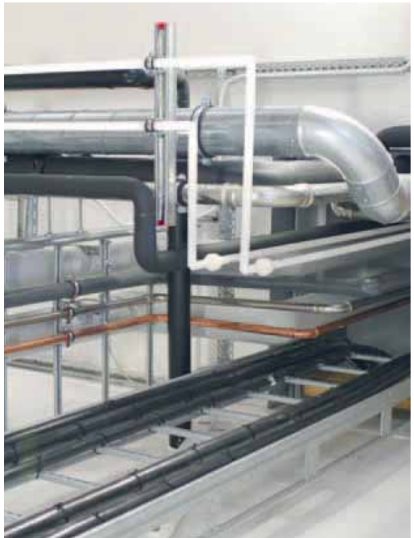
Leine & Linde, Strängnäs, Schweden