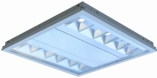
Abbildung beispielhaft Die Type 4.5 hat vier anstatt sechs LED-Module

Technische Änderungen auch ohne Ankündigung vorbehalten. Diese Unterlage ist unser geistiges Eigentum. Sie darf ohne unsere Zustimmung weder vervielfältigt, noch unbefugt verwendet, noch gewerbsmäßig verbreitet oder weiteren Personen vorgelegt werden.